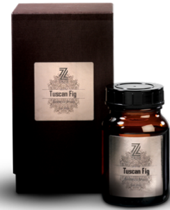
BELLA DONNA R50935

La note de tête est décisive pour que vous aimiez le parfum ou non. Un merveilleux parfum corsé est immédiatement odorant, ces parfums principalement frais ont un effet stimulant pour nous. Les parfums de tête nous rendent heureux et éveillés, ils augmentent notre attention, ils nous rafraîchissent, ils nous motivent. On se réfère également à la note de cœur comme un bouquet. Cette note de parfum prend un certain temps avant qu'elle puisse se développer complètement et jusqu'à ce que nous puissions la percevoir. Les odeurs de cœur sont étroitement liées aux sentiments. Les sensations sont réveillées et activées. Les blocages sont libérés. Il peut donc arriver qu'un tel parfum nous reconforte, ravisse, excite, érotise, apaise, harmonise ou nous équilibre. La note de fond est le dernier des composants du parfum, elle est généralement particulièrement intense et forme la propriété de base d'un parfum. Bien sûr, ce long temps de démarrage apporte quelque chose de complètement différent que la note de tête rapide ; les notes de fonds nous donnent courage, sécurité, concentration, sécurité, calme, endurance et force intérieure.