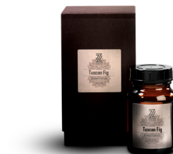
VELVET BEAUTY R49746

La note de tête est décisive pour que vous aimiez le parfum ou non. Un merveilleux parfum corsé est immédiatement odorant, ces parfums principalement frais ont un effet stimulant pour nous. Les parfums de tête nous rendent heureux et éveillés, ils augmentent notre attention, ils nous rafraîchissent, ils nous motivent. On se réfère également à la note de cœur comme un bouquet. Cette note de parfum prend un certain temps avant qu'elle puisse se développer complètement et jusqu'à ce que nous puissions la percevoir. Les odeurs de cœur sont étroitement liées aux sentiments. Les sensations sont réveillées et activées. Les blocages sont libérés. Il peut donc arriver qu'un tel parfum nous reconforte, ravisse, excite, érotise, apaise, harmonise ou nous équilibre. La note de fond est le dernier des composants du parfum, elle est généralement particulièrement intense et forme la propriété de base d'un parfum. Bien sûr, ce long temps de démarrage apporte quelque chose de complètement différent que la note de tête rapide ; les notes de fonds nous donnent courage, sécurité, concentration, sécurité, calme, endurance et force intérieure.