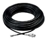
Kit nettoyage canalisation