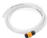
Kit aspiration avec raccord rapide