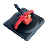
Laveur de sol SC 155