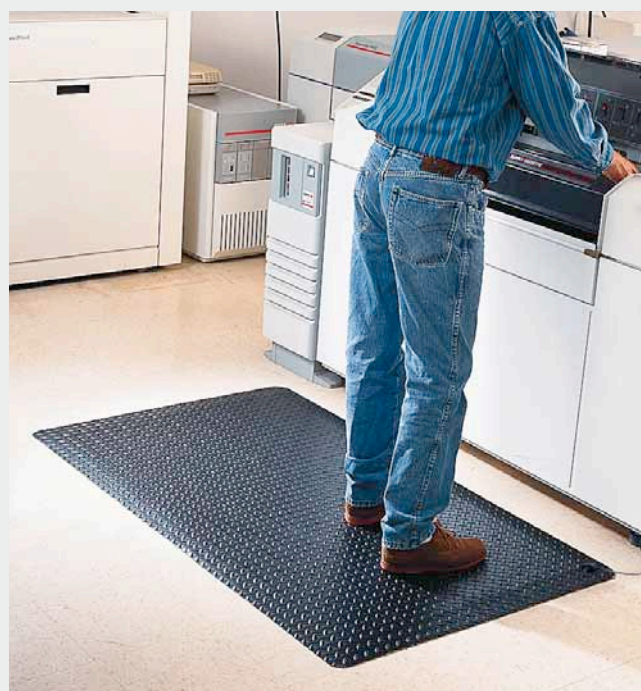
Surface supérieure vinyle relief tôle à larmes

possibilité de fabrication en rouleau : nous consulter